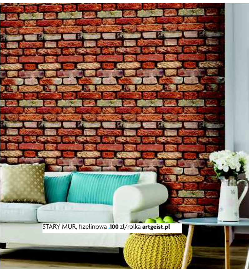
STARY MUR, fizelinowa .100 zł/rolka artgeist.pl

W przypadku cegły sprawa jest o tyle prosta, że to my mamy ostatnie słowo, a nie budowlaniec, który stawiał mur sto lat temu. Możemy więc wybrać cegły stare, zniszczone lub super-nowe; położone w równych odstępach z dużą warstwą zaprawy albo takie, które ciasno do siebie przylegają. No i nie trzeba już ich malować! ■