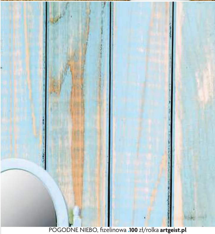
POGODNE NIEBO, fizeleinowa .100 zł/rolka artgeist.pl