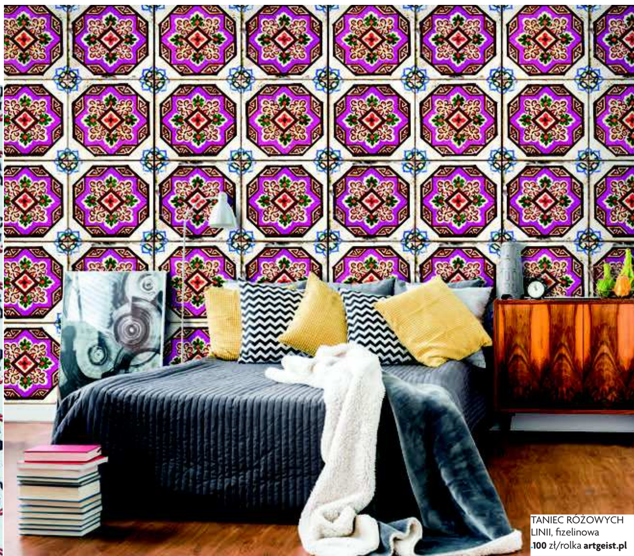
TANIEC RÓŻOWYCH LINII, fizeleinowa .100 zł/rolka artgeist.pl