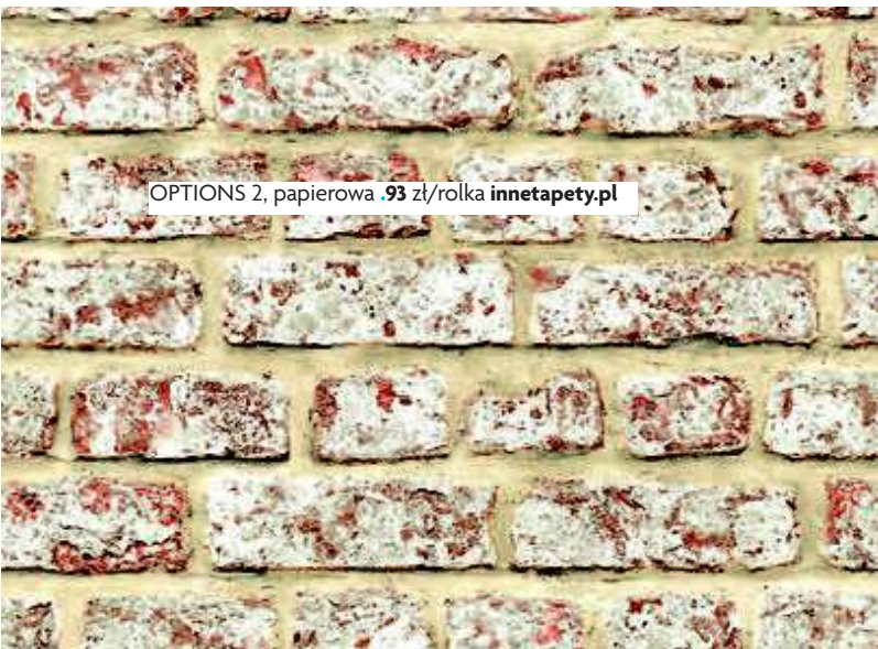
OPTIONS 2, papierowa .93 zł/rolka innetapety.pl