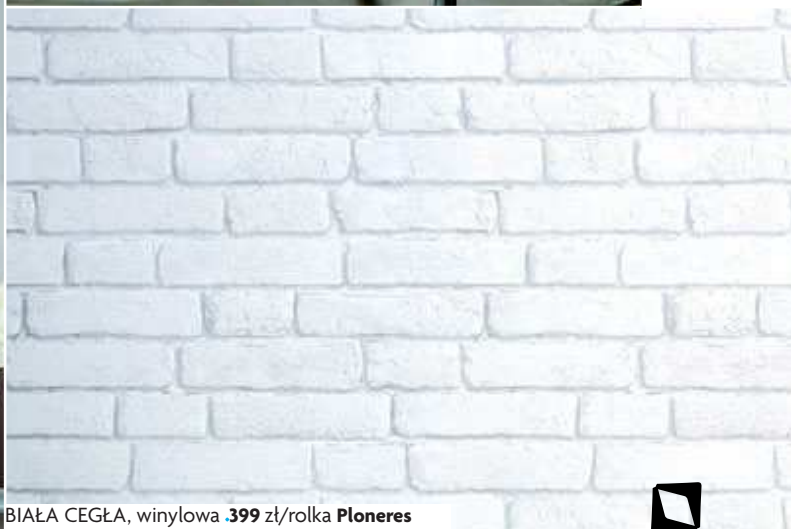
BIAŁA CEGŁA, winylowa .399 zł/rolka Ploneris

POMYSŁ DLA NIEZDECYDOWANYCH: UKŁAD „KOSTEK” PRZYPOMI- NA ŚCIANĘ Z CEGŁY, FAKTURA – SUROWY BETON.