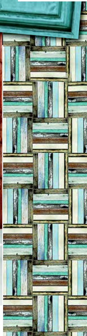
DREWNIANY SPLOT KOLORÓW, fizełinowa .100 zł/rolka artgeist.pl