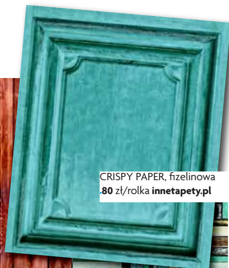
CRISPY PAPER, fizełinowa .80 zł/rolka innetapety.pl

Nie bójmy się kontrastów: tapety z wyraźnym usłojeniem sprawdzą się też w łofcie, a te z naprzemiennie ułożonych deszczutek, kojarzące się z meblami z europalet – w pokoju nastolatka. ■