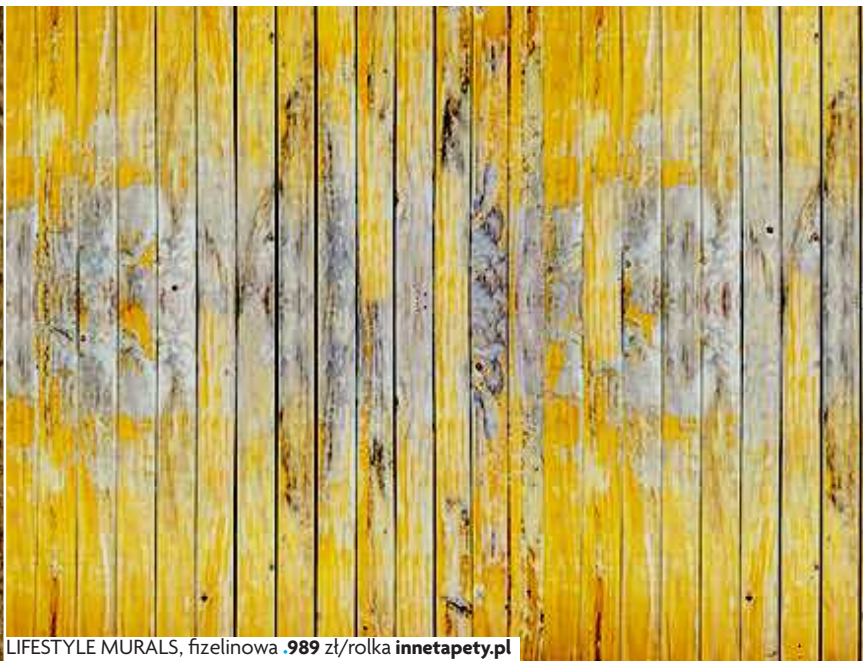
LIFESTYLE MURALS, fizeleinowa .989 zł/rolka innetapety.pl