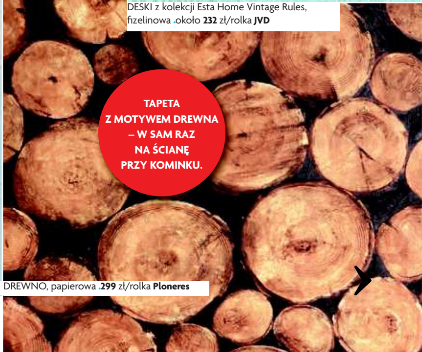
DREWNO, papierowa .299 zł/rolka Ploneres

TAPETA Z MOTYWEM DREWNA – W SAM RAZ NA ŚCIANĘ PRZY KOMINKU.