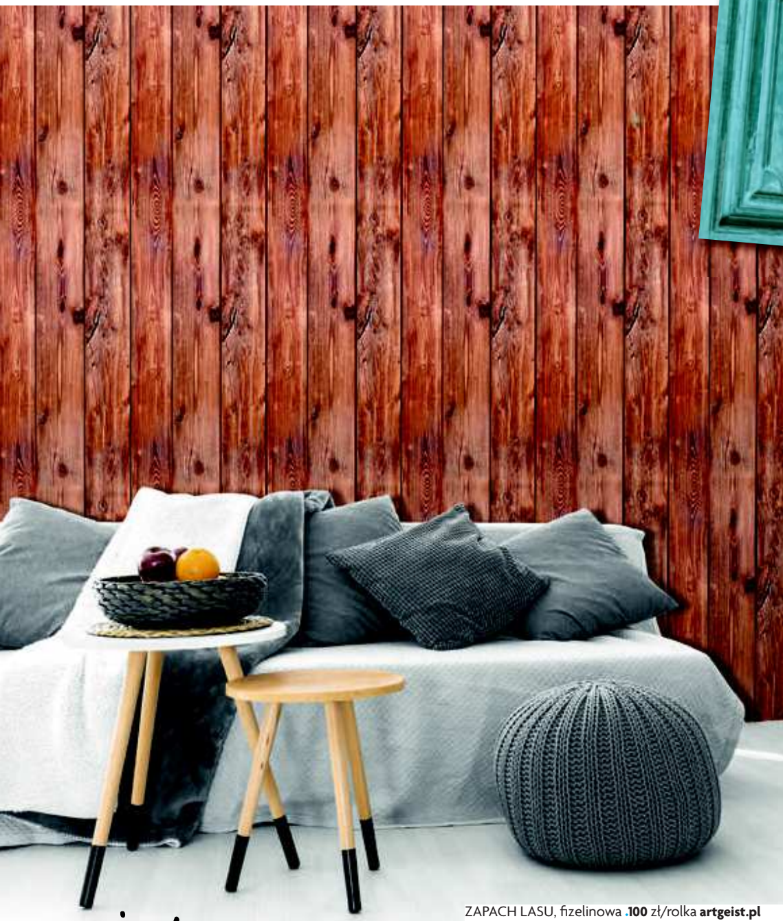
ZAPACH LASU, fizełinowa .100 zł/rolka artgeist.pl