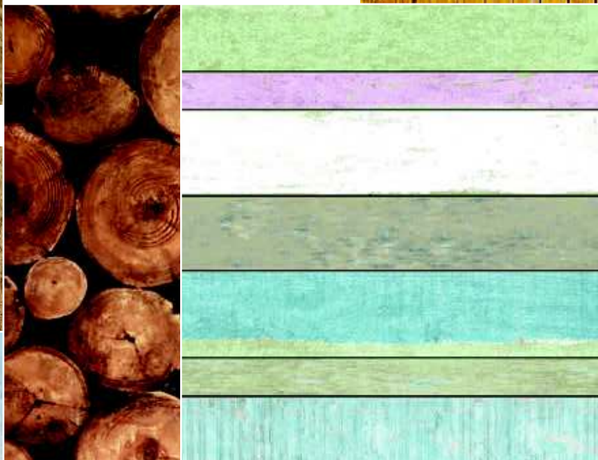
DESKI z kolekcji Esta Home Vintage Rules, fizeleinowa .około 232 zł/rolka JVD

TAPETA Z MOTYWEM DREWNA – W SAM RAZ NA ŚCIANĘ PRZY KOMINKU.