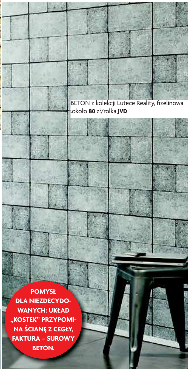
BETON z kolekcji Lutece Reality, fizelinowa około 80 zł/rolka JVD

POMYSŁ DLA NIEZDECYDOWANYCH: UKŁAD „KOSTEK” PRZYPOMI- NA ŚCIANĘ Z CEGŁY, FAKTURA – SUROWY BETON.